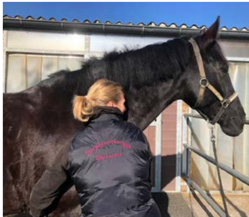
Fascia-Therapie beim Reitpferd.

www.silvretta-tieraerzte.ch www.svtpt.ch