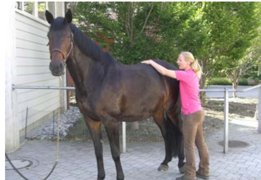
Pferd mit «Kissing Spines»: Mobilisation der Wirbel und Weichteil-Techniken.